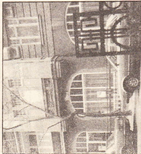
● Die wilhelminische Fassade des Gebäudes in der Isoldestraße in Friedenau, das über Nacht eine noble Adresse geworden ist.

Der stilvolle kleine Konzertsaal in der ruhig gelegenen Friedenauer Seitenstraße hat alles in allem 250 000 Mark gekostet. Den weitaus größten Teil dieser Summe haben die Initiatoren aufgebracht. Das Bezirksamt Schöneberg hat 20 000 Mark zugesteuert und eine große Bank half mit einem zinsgünstigen Kredit. Die ersten Besucher des