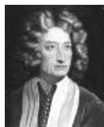
Arcangelo Corelli u.a.