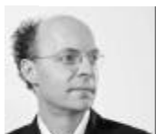
Georg Kallweit Barockvioline